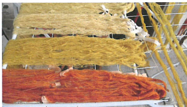
MYND 3 - NÝLITUD ULL