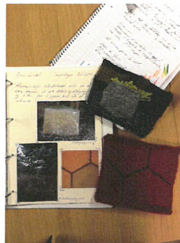
MYND 6 - DÆMI UM HUGMYNDAVINNU

Það er mat þeirra sem að þessu námskeiði stóðu að afar vel hafi til tekist og að mikil ánægja þátttakenda hafi ekki leynt sér enda kemur þar skýrt fram í námskeiðsmatinu (sjá fylgiskjal 2). Það markmið að ná til kvenna í dreifðum byggðum náðist að hluta til en það voru ákveðin vonbrigði að ekki skyldu koma þátttakendur úr Vestur-Skaftafellssýslu. Aðeins sótti ein kona um úr sýslunni en hún er með háskólapróf og starfar ekki sem bóndi og féll ekki að inntökuskilyrðum. Þar sem allir þátttakendur voru búsettir í næsta nágrenni við kennlustað var ekki boðið uppá fjarkennslu sem var eitt af markmiðum námskeiðsins. Hvort námskeiðið hafi orðið raunveruleg kveikja til frekara náms á eftir að koma í ljós en miðað er við að þátttakendum verði boðið uppá viðtal við náms- og starfsráðgjafa þar sem m.a. verður rætt um þann þátt ásamt því að kanna hvort námið hafi haft þau áhrif á þátttakendur sem að var stefnt, s.s. að stuðla að nýsköpun og aukinni nýtingu hráefnis í anda „Beint frá býli“.