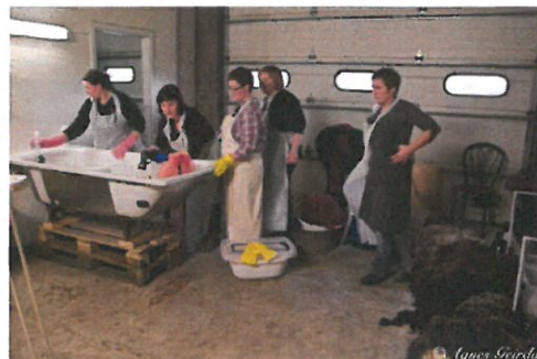
MYND 2 - ULLARÞVOTTUR