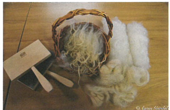
MYND 1 - NÝÞVEGIN ULL OG KAMBAR

Í umsókn var miðað við að námið myndi fara fram í Rangárvalla- og Skaftafellssýslu.