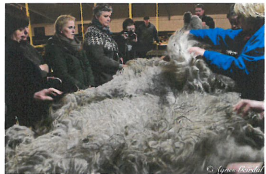
MYND 4 - Í FJÁRHÚSINU

ljósmynd? Þetta er aðferð til að finna nýjar leiðir og opna hugann fyrir nýrri hugsun og sköpun. Að skrá niður og koma í orð því sem maður er að gera og hugsa er verkferli sem nýtist í allri sköpunarvinnu. Eins það að halda utan um þær aðferðir sem verið er að vinna með. Að setja niður smá hugleiðingar í lok tíma er öllum hollt, fara yfir það sem gerst hefur og skrá. Ég var ekki nógu hörð á þessum lið á námskeiðinu. Í lok námskeiðsins, þá fannst nemendum að ég hefði mátt vera harðari á þessu atriði. Að hafa smá umræðu um heimaverkefnið í byrjun hvers tíma er mjög mikilvægt, þarna safnast nemendur saman, hver og einn sýnir hvað hann hefur verið að gera og fær tækifæri til að kynna sjálfan sig og verk sín í jákvæðu umhverfi, að standa með sjálfum sér og tala fyrir framan aðra. Þetta má samt ekki taka of langan tíma í mesta lagi 5 mínútur á hvern nemanda. Að hafa stuttan fyrirlestur strax á eftir morgunspjallinu reyndist líka ágætlega, þá hafa allir einbeitingu til að hlusta og hægt er að kynna þá efnisþætti sem liggja fyrir þann daginn.