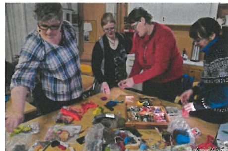
MYND 2 - UNNID MEÐ LITAHRINGINN

Rokkar og kambur voru leigðir hjá Þingborgarkonum en nokkrir þátttakendur áttu sjálfir rokka og kamba. Þeir þátttakendur sem áttu sitt eigið fé unnu með sína eigin ull og útveguðu einnig öðrum þátttakendum ull. Þátttakendur söfnuðu einhverju af jurtum til